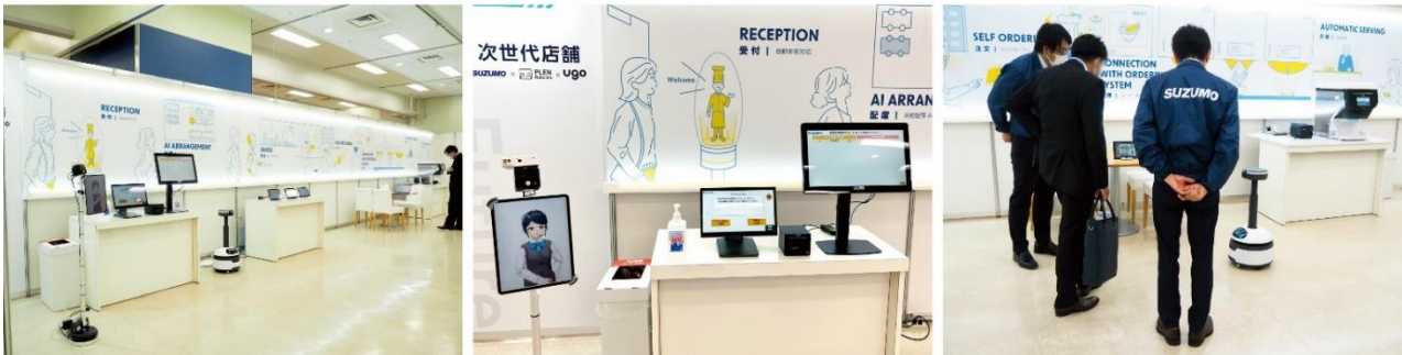
↑スズモフェア 2023 東京の様子