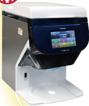
ご飯盛り付けロボット Fuwarica GST-RRR