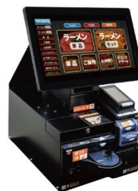
jsp SEMOOR 券売機