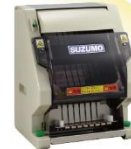
海苔巻きカッター SVC-ATC