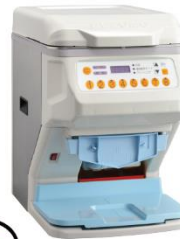
ご飯盛り付けロボット Fuwarica GST-HMA