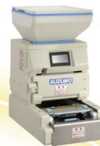
海苔巻きロボット SVR-NVG