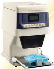
ご飯盛り付けロボット+おむすびオプション GST-FBB-TOA