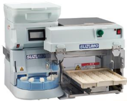
小型シャリ玉ロボット+シャリ玉移載装置 SSN-JLA+TRS-JLA