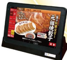
jsp セルフオーダーシステム SEMOOR