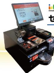
jsp セルフレジ「マジレジセルフ」