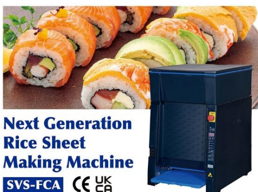
Next Generation Rice Sheet Making Machine SVS-FCA CE UK CA