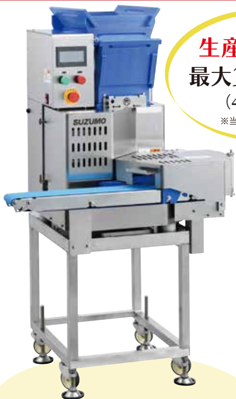
移載装置付排出コンベアおよび キャスター台装着仕様(各オプション)