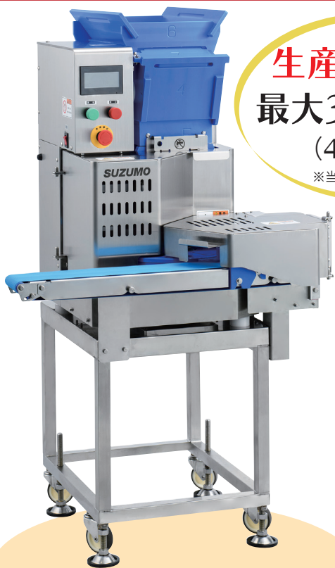
移載装置付排出コンベアおよび キャスター台装着仕様 (各オプション)

真空冷却飯 (油入:20~25℃) ・ ホット飯 (赤飯・おこわ等) に対応可能